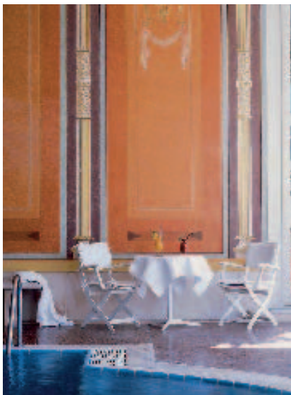
Vor dem Umbau konnten die übrigen Hotelgäste das Beauty-Spa im Untergeschoss nur über einen Flur durch die Villa erreichen.