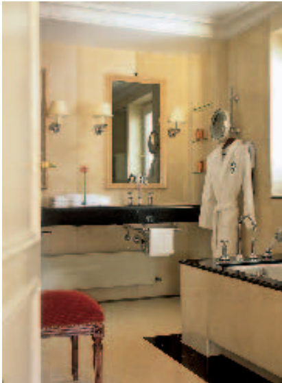
Im gesamten Palais wurden auch die Bäder erneuert, die goldfarbenen Armaturen gegen modernes Design und die Ablagen gegen schwarzen Marmor ausgetauscht.

so beschreibt die Innenarchitektin ihre Gestaltung. Das unterstreicht die französische Tradition Baden-Badens. Dick wattierte französische Stoffe aus Baumwolle und Leinen in Goldgelb, kräftigem Blau oder Rot hängen an den Fenstern, die Wände sind zurückhaltend matt gestrichen. Die Möbel, zum großen Teil Antiquitäten im Stil Louis XVI, zum Teil Kopien aus dem 19. Jahrhundert, wurden übernommen und neu bezogen.