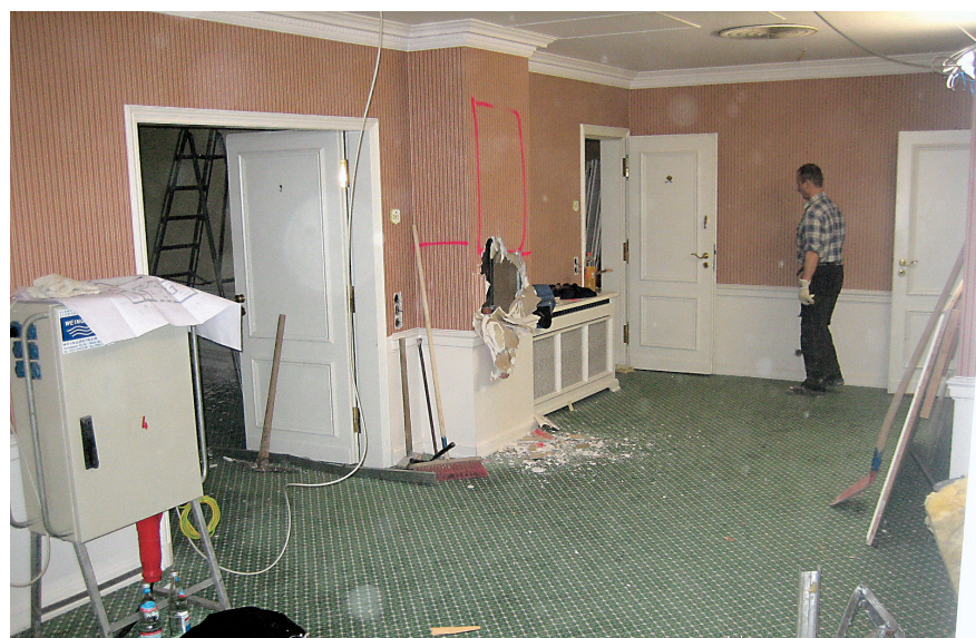
Viele „verborgene Winkel“ bargen die eigentliche Herausforderung des Umbaus. Denn um die Parkvilla bei Bedarf vom Hotelbetrieb abkoppeln zu können, bedurfte es ausgefeilter architektonischer Detailarbeit.

Die echten Probleme aber entstanden im Verborgenen. Beim Einbau eines zweiten Lifts beispielsweise. Denn wie sollten die