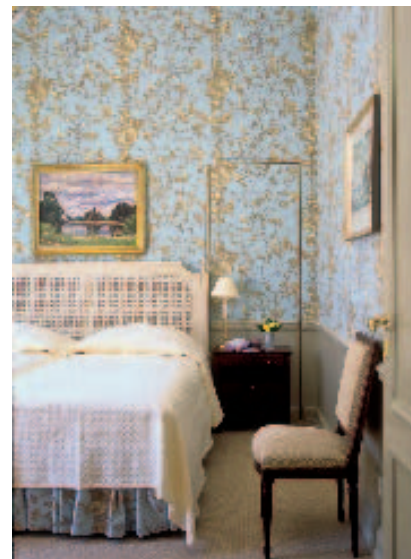
Ein bisschen Understatement, ein bisschen französischer Landschlösschenstil, so beschreibt Bergit Gräfin Douglas ihre Gestaltung.

Hotelgäste aus dem Haupthaus ins Spa gelangen, wenn der Durchgang zur Villa bei Komplettvermietung abgeschlossen wird? Die Lösung: ein zusätzlicher Lift vor dem Durchgang. Leichter gesagt als getan. Nicht nur, dass für den Lift ein Zimmer geopfert werden musste. Größere Konsequenzen brachte das für das Untergeschoss, wo Wasserübergabepunkt und Technikräume liegen. Sie wurden komplett in einen Nebenraum verlegt, veraltete Leitungen bei der Gelegenheit „abgespeckt“, Wasserleitungen einfacher gestaltet, das Kellergewölbe abgerissen und neu abgestützt.